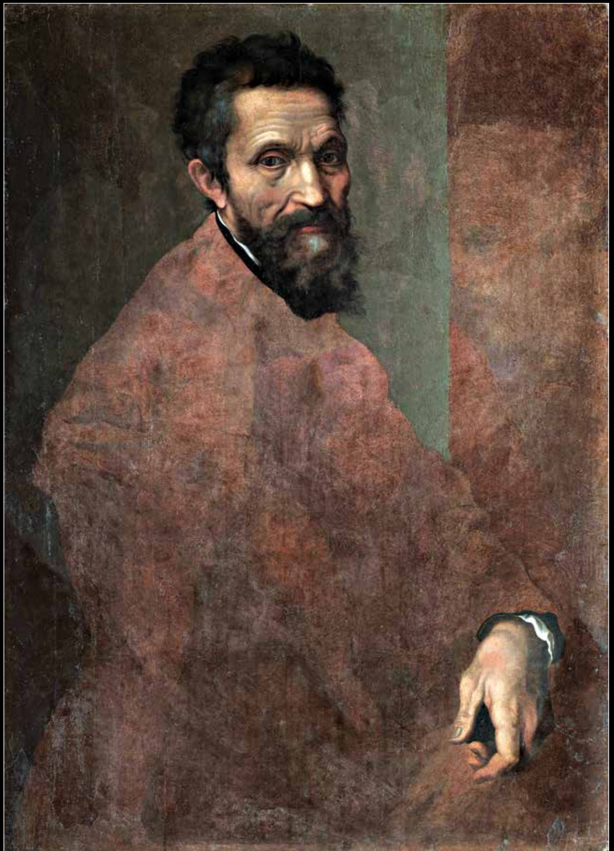
Даніеле да Вольтерра Портрет Мікеланджело Буонарроті (1544)

Адміністрація церкви Санта-Кроче у Флоренції, де був похований Мікеланджело, заборонила ексгумувати його останки для патоморфологічного дослідження. Тому команда із п'яти медичних експертів підійшла до проблеми творчо. У своєму дослідженні 2016 року, опублікованому в «Журналі Королівського медичного товариства», лікарі вирішили спиратися на три портрети художника — два прижиттєві та одну більш пізню копію. Вони дійшли висновку, що Мікеланджело мав остеоартрит, спричинений багаторічною роботою з каменем.